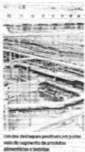
Unidade de produção de produtos alimentícios e bebidas

um crescimento muito elevado", explicou o economista. Continuando a exploração, o índice sofreu retração de 2,6% quando comparado com igual mês do ano passado. Isso demonstra que o crescimento de junho é uma recuperação apenas parcial, ocasionado majoritariamente pela base de comparação baixa imposta", afirma Antônio Martins. O resultado do mês de junho, que será divulgado apenas no início de setembro, é decisivo, segundo Martins, para indicar se está havendo uma recuperação. Segmentos O 11º segmento de indústria leve está em consideração na pesquisa, somente três registraram