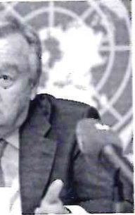
Antônio Guterres falou a autoridades de 40 países reunidas em Berlim

Antônio Guterres, secretário-geral da ONU, comparou a emergência climática, acentuada nas últimas semanas com ondas de calor e incêndios florestais, a um 'suicídio coletivo'.