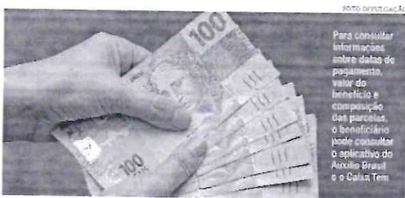
Para consultar informações sobre datas de pagamento, valor do benefício e composição das parcelas, o beneficiário pode consultar o aplicativo do Auxílio Brasil e o Caixa Tem.

Com o valor mínimo de R$ 400, a Caixa Econômica Federal paga nesta quarta-feira (27/04) a parcela de abril do Auxílio Brasil aos beneficiários com Número de Identificação Social (NIS) de final 8. As datas dos pagamentos seguem o mesmo sistema Bolsa Família. Para consultar informações sobre datas de pagamento, valor do benefício e composição das parcelas, o beneficiário pode consultar o aplicativo do Auxílio Brasil e o Caixa Tem. Ambos são usados para acompanhar as contas poupança digitais do banco.