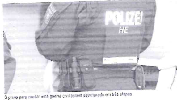
O plano para causar uma guerra civil estava estruturado em três etapas

Os cinco alemães são suspeitos de terem planejado o sequestro do ministro da Saúde e terem tentado depor o governo do país