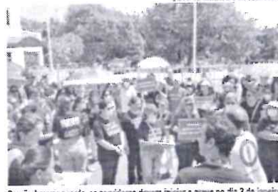
Se não houver acordo, os servidores devem iniciar a greve no dia 3 de janeiro

No último dia 19 de novembro, servidores municipais da atenção primária de Fortaleza de nível superior, que atuam nos postos de saúde, paralisaram as atividades por 24 horas e protestaram em frente ao Paço Municipal. Na manifestação, médicos, dentistas e enfermeiros pediram uma reunião com o prefeito José Sarto, mas foram informados que ele não estava no local. Nesse contexto, os servidores decidiram deflagrar uma greve geral. No dia seguinte, foi feita uma reunião e a paralisação foi marcada para ter início no próximo dia 3 de janeiro. É importante destacar que os profissionais também decidiram interromper funções que não sejam exclusivas de suas competências, uma vez que não se sentem reconhecidos pelo esforço.