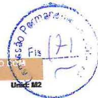
Tabela de Custos - Versão 027.1 - ENC. SOCIAIS 83,85%

C3118 - TACHÃO REFLETIVO MONODIRECIONAL: FORNECIMENTO/APLICAÇÃO Preço Adotado: 45,3800 Unid: UN