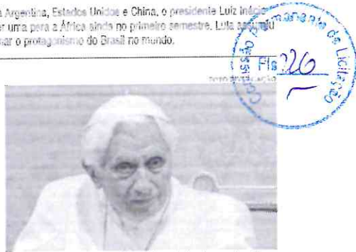
Até o fim da cerimônia, o corpo do papa emérito será enterrado nos grafos vaticanos

Já os republicanos não têm consenso nem sequer para eleger um líder a um cargo já garantido, como o de presidente da Câmara. McCarthy, porém, não pretende tirar seu nome da lista e até aqui não tem um adversário capaz de vencê-lo.