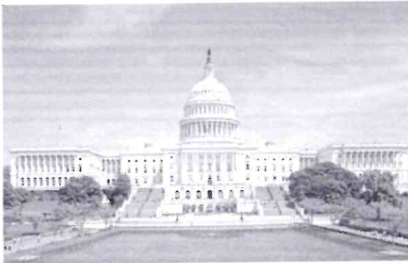
Os deputados terão de votar quantas vezes forem necessárias até que o novo presidente seja escolhido

Não houve quem acordasse tranquilo na alta cúpula do Partido Republicano nesta terça-feira (3), e o que era para ser uma vitória acabou se tornando uma dor de cabeça nos corredores do poder em Washington. Com a posse do novo Congresso dos Estados Unidos, eleito nas eleições legislativas que ocorreram em novembro, os membros do Partido Republicano votaram a ter maioria na Câmara dos Representantes após quatro anos. A mudança significa um aumento expressivo na oposição ao presidente democrata Joe Biden, que até aqui tinha o controle das duas Casas no Congresso.