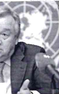
Antônio Guterres falou a autoridades de 40 países reunidas em Berlim

Antônio Guterres, secretário-geral da ONU, comparou a emergência climática, acentuada nas últimas semanas com ondas de calor e incêndios florestais, a um "suicídio coletivo". Ele falou a autoridades de 40 países reunidas em Berlim nesta segunda (18). "Metade da humanidade vive em zonas de perigo de inundações, secas, tempestades extremas e incêndios florestais", afirmou o português, segundo relato do jornal britânico The Guardian. "Mas continuamos alimentando nosso vício em combustíveis fósseis; nós temos uma escolha: a ação coletiva ou o suicídio coletivo".