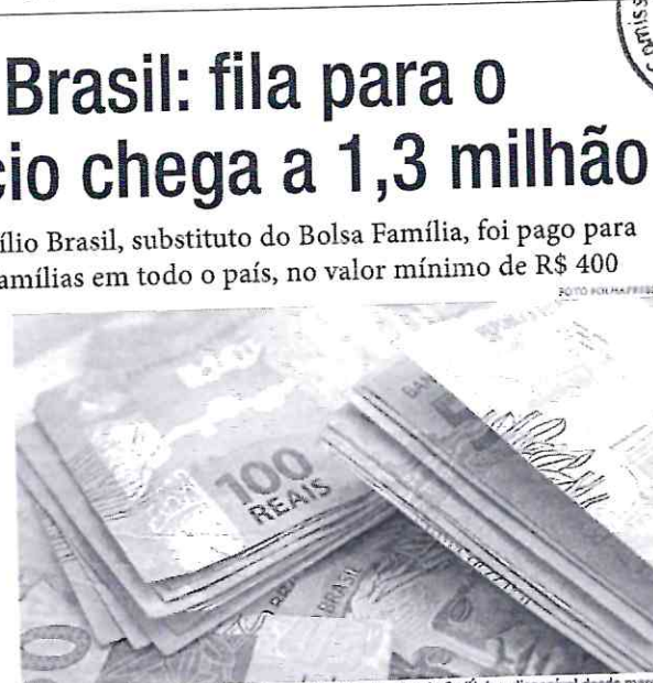
O cadastro para o Auxílio também pode ser feito via aplicativo do CadÚnico, disponível desde março

Optimismo. O Índice de Confiança do Empresário do Comércio (Icec), apurado pela Confederação Nacional do Comércio de Bens, Serviços e Turismo (CNC), alcançou 120,2 pontos, após o volume de vendas no varejo apresentar altas consecutivas e surpreendentes. Este é o maior nível desde dezembro de 2021.