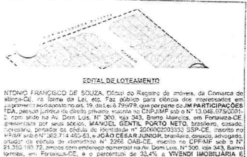
EDITAL DE LOTEAMENTO