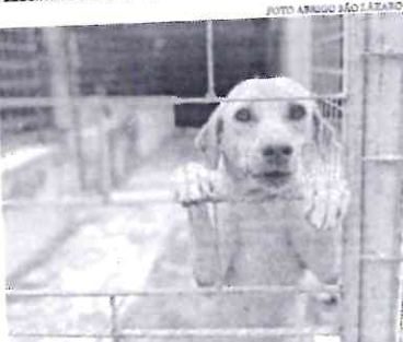
Abandono, entre cães e gatos, há mais de 1200 animais resgatados no abrigo.

Em outubro de 2021, o Abrigo São Lázaro conseguiu chamar a atenção do Poder Público após anunciar que estavam encerrando as atividades de resgate por falta de recursos. Na