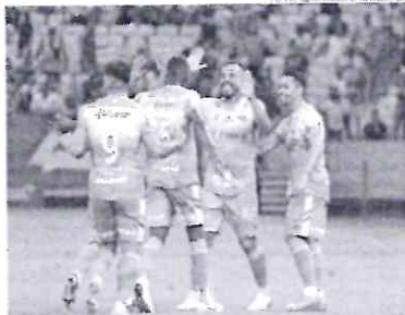
Com a vitória, Leão se isolou na liderança do grupo A, com 12 pontos