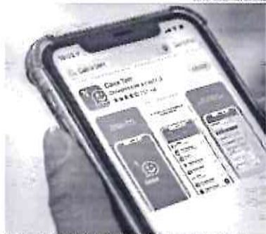
Os valores só podem ser movimentados por meio do aplicativo Caixa Tem, que permite o pagamento de contas domésticas

Estável. A taxa de desemprego no Brasil ficou no 11,1% no 1º trimestre de 2022, mostrando estabilidade frente ao 4º trimestre, com a falta de trabalho ainda atingindo 11,949 milhões de brasileiros, segundo divulgou o Instituto Brasileiro de Geografia e Estatística (IBGE).