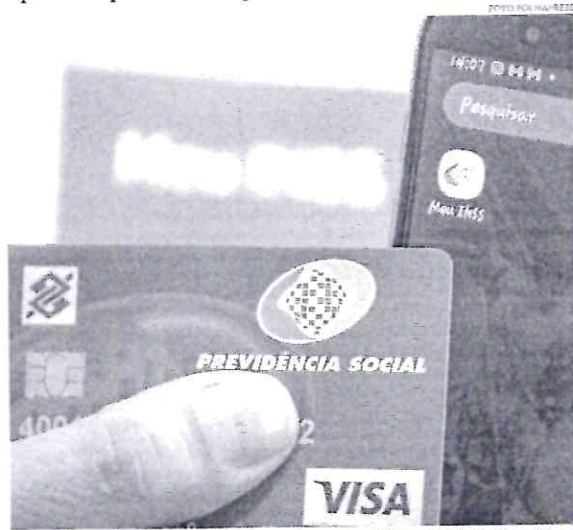
Até dezembro de 2021, o número máximo de parcelas mensais para pagar a dívida segue ampliado de 72 para 84 meses

decididos pelo conselho, além da quantidade meses para pagar e do limite que pode ser emprestado pelo aposentado. Até o final de 2021, esse limite de empréstimo está em 40% do benefício; são 35% para o empréstimo e 5% para o cartão de crédito. A partir de 2022, as regras devem voltar ao que valiam antes da pandemia e o aposentado ou pensionista poderá comprometer até 35% de sua renda mensal com essas dívidas: 30% para o empréstimo e 5% para o cartão de crédito consignado.