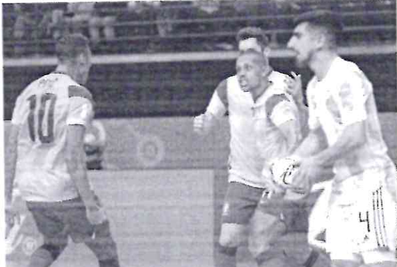
Última vez que o Brasil tinha sido finalista da competição foi na edição de 2012, onde se conquistou o pentacampeonato.

Atual campeã mundial, a seleção argentina de futsal terá a oportunidade de buscar o bicampeonato consecutivo. Nesta quarta-feira (29) na Lituânia, o time argentino venceu o Brasil por 2 a 1 pela semifinal da Copa do Mundo da modalidade e garantirá uma vaga na decisão. Esta é a segunda edição seguida em que a seleção brasileira não consegue alcançar a final. Pentacampeão, foi finalista pela última vez em 2012, quando conquistou seu quinto título mundial - em 2016, caiu nas oitavas de final para o Ira.