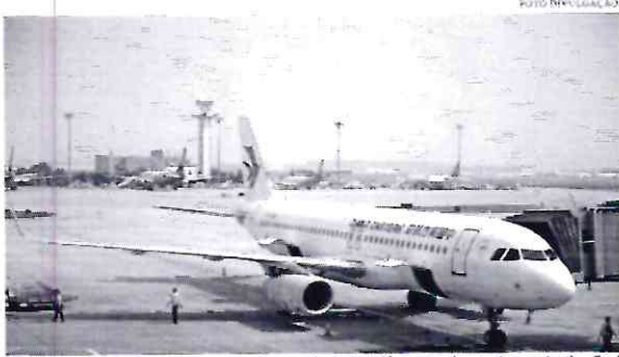
Aeroplano era similar ao da fotografia acima e caiu quando já se aproximava de seu destino final

Um Boeing 737-800 da companhia China Eastern Airlines com 132 pessoas a bordo, sendo 9 tripulantes e 123 passageiros caiu nesta segunda-feira (21) no sudoeste da China e o número de mortos e feridos ainda é desconhecido, informou a Administração de Aviação Civil da China. A empresa aérea confirmou que há mortes, sem precisar o número. "A companhia expressa suas mais profundas condolências aos passageiros e tripulantes que morreram no acidente", diz um comunicado da empresa à Bolsa de Valores de Xangai, onde está listada. Autoridades chinesas informaram ainda que não há registros de estrangeiros no voo, de acordo com a CGTN, emissora estatal chinesa.