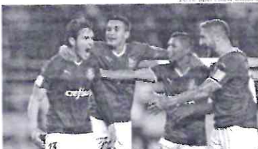
No momento, o Palmeiras espera o vencedor da partida entre Chelsea e Al-Hilal para saber o seu adversário na final pelo terceiro lugar.

O Palmeiras está perto de alcançar aquele que é seu grande objetivo. A equipe alviverde é finalista do Mundial nos Emirados Árabes Unidos, classificação obtida nesta terça-feira (8), com uma vitória por 2 a 0 sobre o Al Ahly do Egito. Foi um bom jogo dos comandados de Abel Ferreira no estádio Al Nahyan, em Abu Dhabi. Raphael Veiga e Dudu se revezaram nos papéis de garçons e artilheiro, comandando o triunfo do campeão sul-americano sobre o campeão africano.