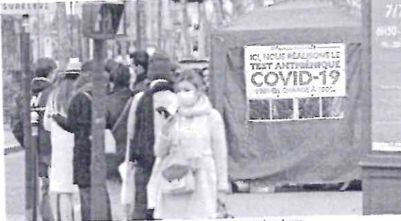
Cenário na Europa é de uma trégua que pode trazer uma paz duradoura

O segundo fator mencionado por Kluge é a menor gravidade de ômicron. Embora seja mais contagioso que outras cepas do coronavírus, essa variante pode causar infecções com sintomas mais leves, de acordo com estudos preliminares. Há, no entanto, uma preocupação da OMS com o fato de essa percepção levar governos e populações a considerarem que medidas de