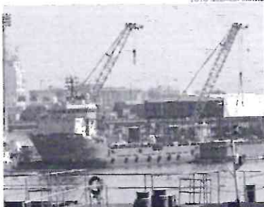
GOVERNO PREVE QUE SUPERÁVIT ALANCE A QUANTIA DE US$105,3 BILHÕES NESTE ANO. BC PROJEJA US$70 BILHÕES

das commodities sustentou as exportações. Em julho, o volume de mercadorias embarcadas sofreu retração de 8% no igual período de 2020. Porém, os valores tiveram aumento de em média 43,1% na mesma comparação. O milho, um dos produtos mais exportados, sofreu queda na safra devido às secas e geadas, o que ocasionou a retração de US$223 milhões em julho na comparação com o mesmo mês do ano passado.