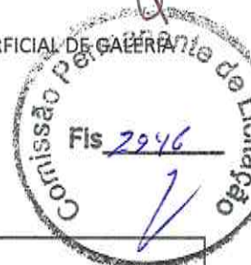
TABELA DE COMPOSIÇÃO

OBRA: CONSTRUÇÃO, MANUTENÇÃO E RECOMPOSIÇÃO DE PAVIMENTAÇÃO EM PEDRA TOSCA E DRENAGEM SUB-SUPERFICIAL DE GALÉRIA TABELA: SEINFRA 26.1 DESONERADA